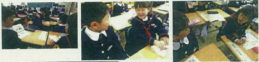
国語のお勉強では、わたしは、〇がすきです。とペアの友達に自分のことをお話ししました。