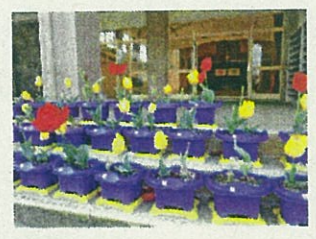
授業をおこなうこともありますが、これから、どうぞよろしくお願いいたします。

学校でエプロンのたたみ方を行いました。休みの間、練習できるように手順をお知らせしました。