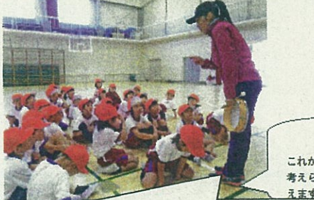
「話を聴く」 これが小学校では、一番大事にしていることです。聴く子は、あれこれ考えられます。聴く子は、知識が増えます。聴く子は、できることが増えます。どうぞ、お家で聴くことを大事にしてくださいと思います。

教師の育てたい力を家庭に配信しておくことで、同じ目的をもって子供を育てていってくれます。