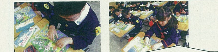
算数のお勉強では、数を数えるとき、比べるときにどのようにして比べたらいいのかのブロックを使って勉強しました。

学校でたくさんのお勉強を行っている子供たちは、家庭に帰り、お家の方に「今日は何をしたの？」と尋ねられても伝えられないことがあります。そこで、少しどのようなことを行ったのかを写真で示すことで、話すきっかけができるのではないかと思います。