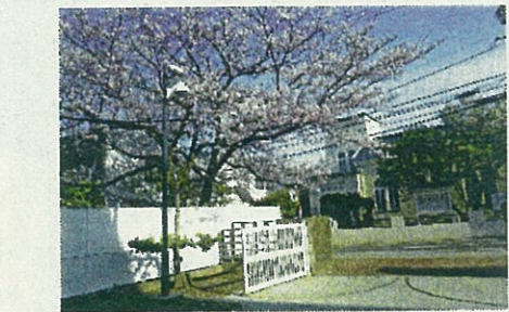
ようこそ 附坂出小へ みんな1年生を持っていました。