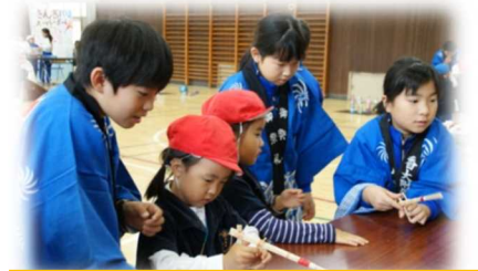
お祭り屋台プロジェクト！！