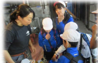
白2ワイワイフードコート