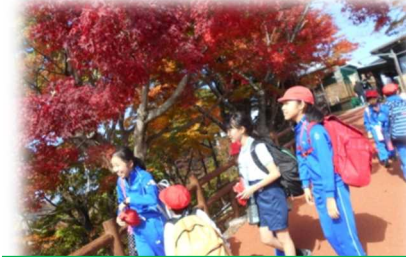
エンターテイメントショー