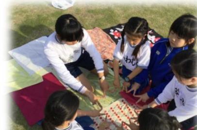
伝統ふろしきミュージアム