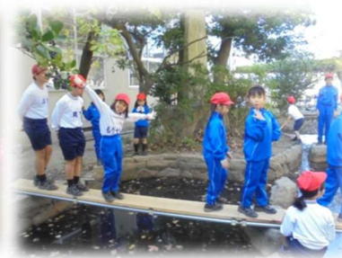
ひょうたん池大改造！！