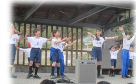
レッツ・ヒップ・ポップ！