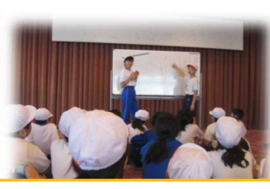
つくって遊んで！ わくわくおもちゃまつり！