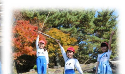
最高の遊びを考えよう