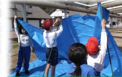
自然とふれあうサバイバル体験