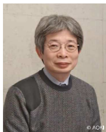
講演者 平田オリザ氏

劇作家・演出家・青年団主宰。こまばアゴラ劇場芸術総監督・城崎国際アートセンター芸術監督。1962年東京生まれ。国際基督教大学教養学部卒業。1995年『東京ノート』で第39回岸田國士戯曲賞受賞。1998年『月の岬』で第5回読売演劇大賞優秀演出家賞、最優秀作品賞受賞。2002年『上野動物園 百々々襲撃』(脚本・構成・演出)で第9回読売演劇大賞優秀作品賞受賞。2002年『芸術立国論』(集英社新書)で、AICT評論家賞受賞。2003年『その河をこえて、五月』(2002年日韓国民交流記念事業)で、第2回朝日舞台芸術賞グランプリ受賞。2006年モンブラン国際文化賞受賞。2011年フランス国文化省より芸術文化勲章シュヴァリエ受賞。2019年『日本文学盛衰史』で第22回鶴屋南北戯曲賞受賞。大阪大学COデザインセンター特任教授、東京藝術大学COI研究推進機構特任教授、四国学院大学客員教授・学長特別補佐、京都文教大学客員教授、埼玉県富士見市民文化会館キラリ☆ふじみマネージャー、日本演劇学会理事、(財)地域創造理事、豊岡市文化政策担当参与。