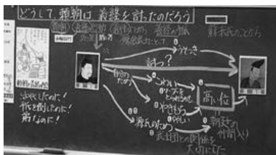
【思考活動を板書に】

その後、子どもたちからは、「朝廷から高い位をもらった義経を妬み、自分の立場を守ろうとしたから」という頼朝の保身的な考えだけでなく、「武士団を裏切る行為をしたから」という源氏のためを思った行動としてとらえる発言も出された。これらの意見を、頼朝が義経を討った理由として、2人の写真の間に位置付けていった。