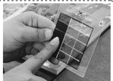
【分数シートを用いて説明】

面積図を使って、 4/5 \times 1/3 の計算の仕方を説明する学習である。形式的に分母同士、分子同士をかけることを理解するだけではなく、それを構造的にとらえさせようとする実践であった。そのために分数シート(右写真)を重ね合わせ、積の部分や区切り線に着目させることで、面積図を式とつないで計算の仕方を確認する場を設定した。