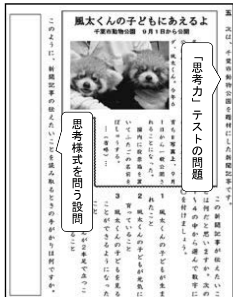
【「思考力」テストの一部（国語科）】