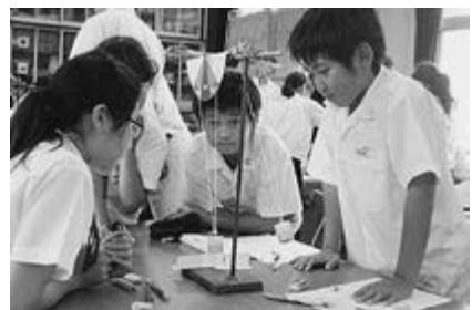
【2つの振り子の動きを比べて】

この教材により、子どもたちは「『おもりの移動距離』が長くなっても『おもりは速く』なるので周期は変わらない。」と視点を明確にとらえて発言できるようになった。