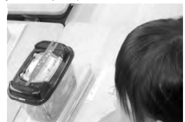
【生き物の住みかを考える】

本実践では、子どもたちが飼育している生き物が、いつまでも元気でいられるようにするための世話のしかたを考えていった。子どもたちは、これまでの経験から住みかと餌に気をつける必要があることは捉えていた。そこで、それぞれの生き物を捕まえてきた場所を写真を用いて想起することで、住みかは、その生き物が元いた場所に近い環境にすればよいことに気付き、世話のしかたをより具体的に考えていった。また、餌をやり過ぎたときに水槽の水が汚れ、生き物の元気がなくなったという経験を振り返り、餌のやり方も工夫するとよいことに気付いていった。このように、経験を基に住みかや餌に関する世話のしかたを具体的に考えた。その後、同じ生き物を飼育している友達と世話のしかたについて交流することで、よりよい世話のしかたの工夫を見だし、日々の飼育活動の中で実践していった。