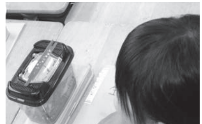
【住みかから世話を考える】

本実践では、子どもたちが飼育している生き物について、いつまでも元気でいられるようにするための世話のしかたを考えていった。子どもたちは、これまでの飼育活動を通して、住みかと餌に気をつける必要があることは捉えていた。そこで、それぞれの生き物を捕まえてきた採集場所を想起することで、住みかを元の環境に近い環境にすればよいことに気付き、世話のしかたをより具体的に考えていった。また、餌をやり過ぎたときに水槽の水が汚れ、生き物の元気がなくなったという経験を振り返ることで、餌のやり方も工夫するとよいことに気付いていった。このように、経験を基に、住みかと餌に関する世話を具体的に考えた後、同じ生き物を飼育している友達と世話について意見交換することで、よりよい世話のしかたの工夫を見だし、日々の飼育活動の中で実践していった。