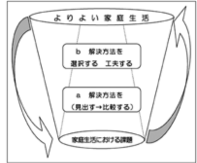
【家庭科「思考力」モデル図】

そこで、本校家庭科では、培いたい「思考力」を「生活事象を多面的に見直す観点を見出し、解決法を総合的に捉える力」「よりよい生活づくりに向け、自分の家庭生活に適した解決法を選択したり工夫したりする力」の2つに分け、分析することで、様々な生活事象を見直し、他者と共生しながらより楽しく豊かな生活を創っていく力を育成することができると考えた。