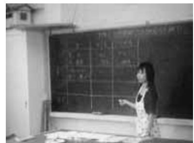
【意見を表に整理する】

このことによって、何と何を比較しているか意識をもって調べに取り組むことができ、生の物を食べた後に、ゆでた物を食べ、その違いを比べようとする姿が見られた。