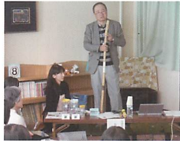
浸水対策には「さぐり棒！」

四国における地震や津波について、歴史からの学びを現在に生かす大切さ、現代の様々なデータからの想定情報を知る大切さ等、詳しくわかりやすく伝えてくださいました。「ハイテク防災術」だけでなく「ローテク防災術」に目を向け、非常時に何を備えるとよいか、何ができるかを日々意識しておくことが身を守ることにつながる話は納得でした。【自分が死んではいけない】【自分が守らなければならない人を最後まで守り抜く】という言葉が心に残りました。早速、〈じしんまんの5ひきの手下〉から守る正義の味方〈やっつけるんジャー〉について、子どもと一緒に話し合い、防災に備えていきたいと思えます。新聞紙スリッパ、ロープワーク等、実際役立つことも多く学ぶことができました。