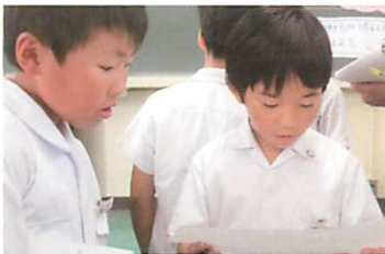
【ペア対話で情景を膨らませる】

本単元では、曲の拍子（2拍子・3拍子・4拍子）を身体表現を通して感じ取ることで、曲を形づくっている要素と拍子を結びつけながら曲想を捉え、情景を豊かに想像することをねらいました。しかし、曲に合わせた身体表現のみでは音の高低や強弱・リズムで拍子を捉えてしまうということが考えられます。その結果、曲想から拍子を決めてしまい、違う拍子と捉えたまま情景を思い浮かべてしまう様相が見られました。そこで、本時は、同じ3拍子で調の違う2曲のメヌエットを聴き比べました。