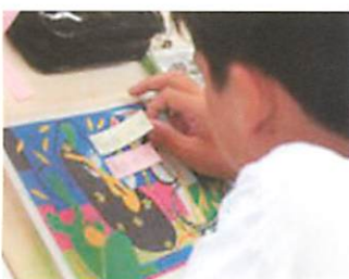
【付箋で工夫を表示】

本単元では、有名な画家の美術作品から受けたイメージを深め、それが表れるように、水彩絵の具で表される形や色について吟味する力を育てることをねらいました。