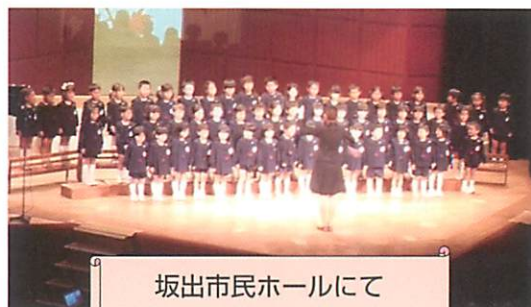
坂出市民ホールにて

歌が大好き、隣には一緒に歌える友達がいるという安心感、歌うたびに自信がついていく嬉しさ、自分を出せる気持ちよさ、……そんな気持ちを味わいながら、歌声もだんだんとまとまってきました。そして、前日、年少の黄組さんが発表の様子を見に来てくれました。小さい人から憧れの眼差しと応援のエールをもらったことで、『黄組さんの分もがんばらなくっちゃ!』と子どもたちは音楽祭への自信をよりいっそう高めることができました。異年齢のかかわりがお互いを高め合う附属幼稚園の伝統がここにも感じられました。