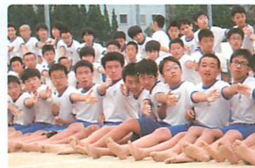
かけがえのないなかま