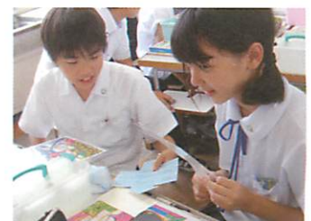
【矢印付きシートで説明】

その際、まず、ラミネートをした図版にマーカーで直接イメージしたことを記した上で、試しの作品についての形や色についての工夫を付箋に記入して貼りました。これを示しながら説明することで、工夫とその意図を明らかにし、具体的に共通点や違いについて、話し合えるようにしました。次に、ペアや全体で作品について話し合うときのやりとりの仕方や相手の意見に共感しながら話し合った経験を、掲示で振り返りました。それにより、「カラフルにしてにぎやかさを表しているのがいいですね。私は線の長さを変えて、楽しく踊っているイメージにしました。」「線の形を変えているのがいいですね。私は赤や黄の明るい色で…」のような対話が生まれました。そして、「ほかはこれから、形だけでなく色の種類や明るさを工夫していこう」等、新たな視点を見つけながら、よりイメージに近づけるための表し方を吟味していくことにつながりました。