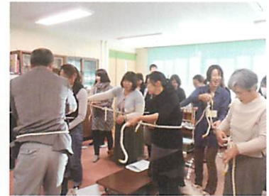
「もやい結び」に挑戦中