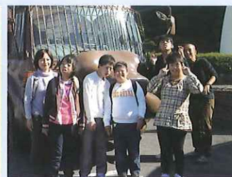
修学旅行 アフリカンサファリ