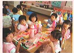
野菜も食べて、元気になるよ！

毎月、身体計測の時間に、養護教諭が「健康」についてのお話をしています。そして、それを聞くことで自分の生活を振り返ったり、生活の中で挑戦してみようという気持ちになったりすることを願っています。11月は、「食べることが元気のもとになる」ことについて、ビデオや紙芝居を使ってお話ししました。今、忍者の修行が遊びの中で盛んになっている年中組では、「にんじん忍者、にんにんまる」が、野菜を使って「きんざえもん」という悪者をやっつけるお話でした。その後のお弁当の時間では、いつもは食べられない野菜にも向き合うことができました。