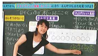
【当てはめたリズムに変えて演奏する】

本単元は、リコーダーの旋律は同じでも、伴奏が違う2種類の「にじ色の風船」を教材として取り上げ、「強弱や速度を工夫していても、伴奏がないと2曲の違いが伝わらないよ。」という認識のズレから2曲の伴奏を聴き比べる活動を設定しました。そして、それぞれの伴奏から感じたイメージと、身体表現によって体感したリズムとを結び付ける学習を意図しました。