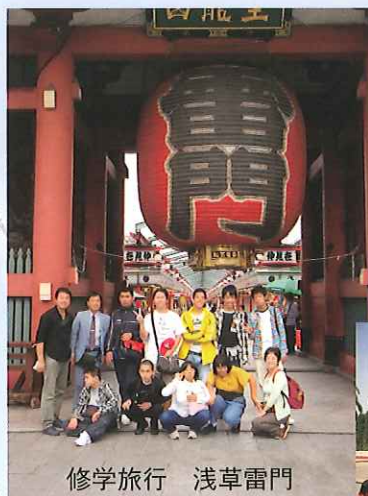
修学旅行 浅草雷門