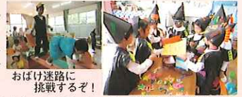
おばけ迷路に挑戦するぞ！

10月30日、青組さんがずっと準備していたハロウィンパーティーがいよいよ開幕。おばけ迷路やアメ探し、くじ屋やじゃんけんゲームなど、青組さんたちが考えて作ったいろいろな催しを、黄組や赤組さんたちが大喜びで楽しみました。青組は自分たちの手で考えて進め、やり遂げた充実感を味わい、黄組や赤組は年長児らしい思いやりや工夫を身をもって感じたことでしょう。