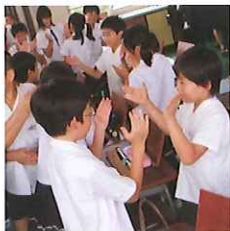
【曲に合わせて身体表現する】

本単元は、リコーダーの旋律は同じでも、伴奏が違う2種類の「にじ色の風船」を教材として取り上げ、「強弱や速度を工夫していても、伴奏がないと2曲の違いが伝わらないよ。」という認識のズレから2曲の伴奏を聴き比べる活動を設定しました。そして、それぞれの伴奏から感じたイメージと、身体表現によって体感したリズムとを結び付ける学習を意図しました。