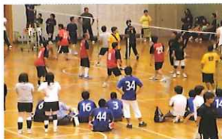
市Pソフトバレーボール

7月5日(日)、市ソフトバレーボール大会、また7月12日(日)には市Pバレーボール大会開催され、白熱したプレーに大いに盛り上がりました。7月26日(日)には四附連球技大会が附属高知学園で開催されました。残念ながら天候不順のため、男子ソフトボールは試合途中で中止になりました。お母様方のバレーボールを皆で応援し、懇親を深める事が出来ました。