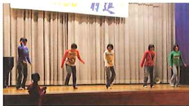
ステージ前半は生徒有志による発表!!!