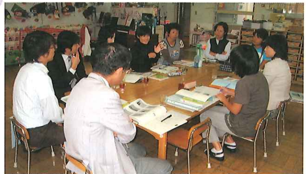
〈事例研究を深める〉 ～園外より先生方をお迎えして～