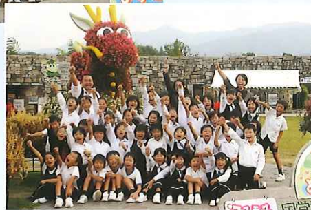
「1, 2, 3, ダー！」