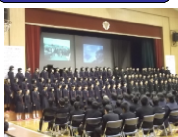
「3年団有志による合唱」 他