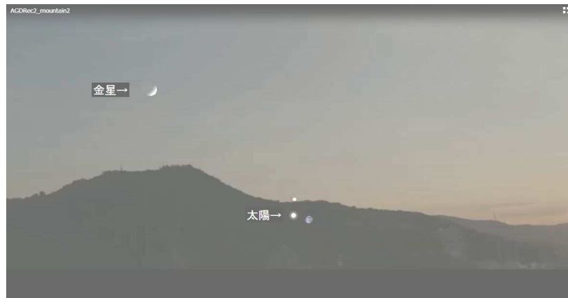
図 2. 宇宙空間モードで見た金星と太陽。重ねてあるのは、高松からの夕方の山 (紫雲山) の風景であり、山の部分は半透明にしている。惑星や太陽の“拡大率”は 3 としたため、金星が三日月のように見えている。太陽の上に見えているのは天王星、右隣は地球である。

太陽から離れた所にいるとして、金星を観察することにした。この状況では、金星は、天球上で太陽を中心に往復する様子を見ることができる。このモードの問題の一つは、地上からの見え方と関連付けることが難しいことである。そこで、フリーソフトの AviUtl (ver.1.00) を用いて、地上からの風景と重ねてみた (図 2)。このモードでの別の問題は、金星の軌道全体をパソコン画面上で見るためには、太陽からかなり離れる必要があり、この結果、地球自体も画面上に見えてしまうことである (図 2 の太陽の右隣が地球)。つまり、地球から離れた仮想的な惑星から見た状況になってしまう。しかしながら、太陽が固定されているので、太陽の周りを金星が公転しており、その様子を横から見ていると想像することは、プラネタリウムモードよりは、容易であるように思われる。