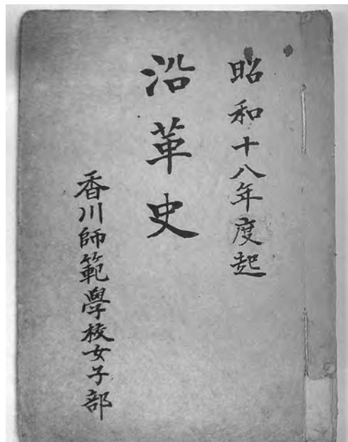
図2 「昭和十八年度起 沿革史」 6) の表紙