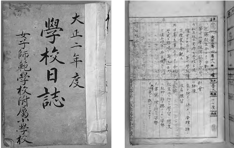
図1 大正2年の附属坂出小学校の「学校日誌」の表紙(左図)と最初のページ(右図)。同校に保存されている「学校日誌」の最初のものである。使われていた原稿用紙には、「綾歌郡第二坂出尋常小學校」と印字されている 5) (右図)。

聞記事が添付されている。この中で、1933年10月25日の記事には運動会の種目が掲載されていたので、付録1に示す。