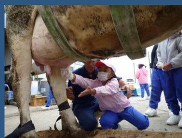
搾乳 ミルクの温かさに感動。