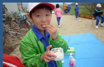
手作りバター 自分で作ったバターは格別です。