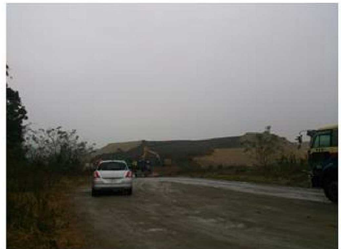
南から見た学校跡地(2014/11/1撮影)

学校の標高は2mほどで、海からも約430mと近く、地震の際に津波を警戒した避難の必要な学校である。学校のすぐ横に小さな山はあるが、登れるような斜面の山ではない。およそ1kmほどの道のりで学校の北に位置する野蒜駅のさらに北にある山に行くことができるが、行く途中で運河があり津波からの避難を考えると注意が必要である。