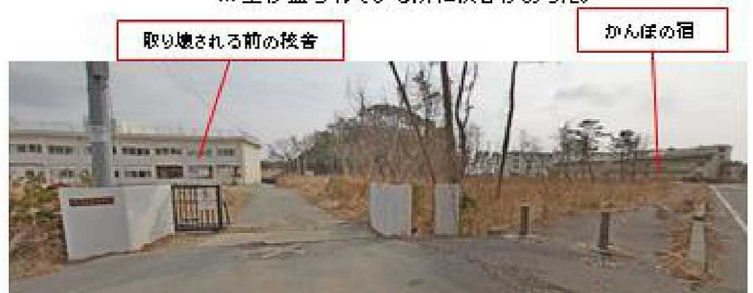
学校とかんぼの宿