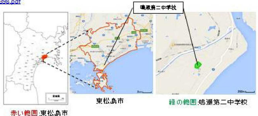
赤い範囲:東松島市