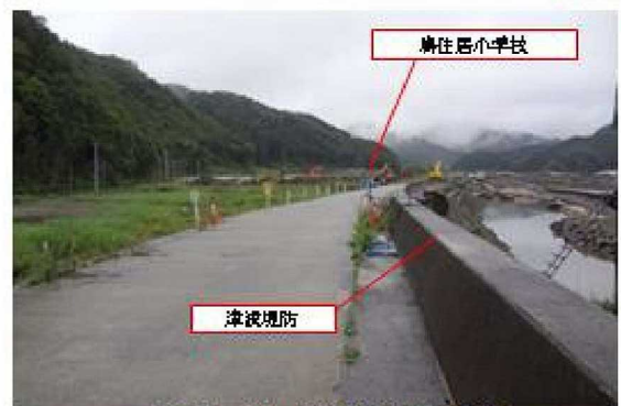
鶴住居川の堤防と鶴住居小学校の位置関係(2013/9/2撮影)

ごさいしょの里での避難中に保護者に引き渡された児童の内1人が津波によって亡くなった。