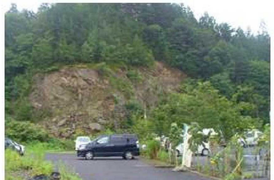
ごさいしょの里の崩れかかっていた崖(2013/9/2撮影)

一次避難場所のごさいしょの里は学校から800mほど離れているが、標高は6mほどしかない。また、ごさいしょの里の手前の道路は1.5mほど標高が下がる箇所があり、津波の避難場所として安心できる場所ではない。また、二次避難場所の老人福祉施設は学校から約1kmの距離にあり、標高は13mほどで、ちょうど津波が到達した高さであった。最終避難場所となった石材店は、学校から1.6kmほど離れており、標高は約44mあり、安全な避難場所としては、石材店が最も適している。しかし、学校から石材店までは大人の足で早歩きでも約18分かかかるので、津波が到達するまでに児童が避難するためには、実践的な避難訓練と学校周辺の地形の知識が必要である。