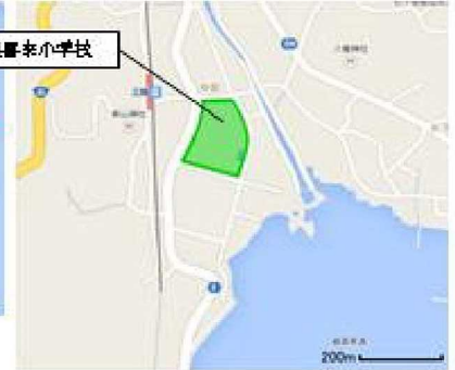
緑の範囲:越喜来小学校