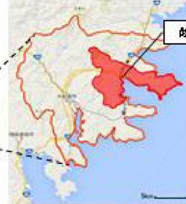
赤い範囲:三陸町越喜来