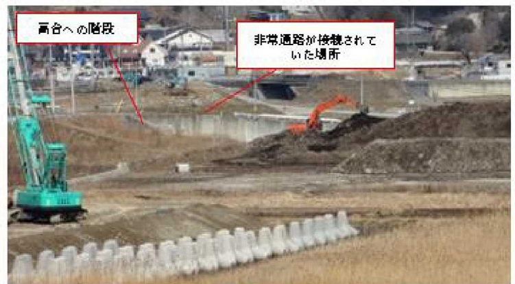
非常通路のあった場所(2014/3/17撮影)

学校の敷地は6mほどの標高しかなく海や川のすぐ近くにあり、津波から避難するためには迅速な行動が必要とされる場所であった。予め決められていた避難場所である三陸駅(標高約24m)へ行くためには一旦川に近づく経路を通ることになり、地震の後に通るには危険な経路であった。そのことから、高台への非常通路や石階段が有効なものであったことが分かった。