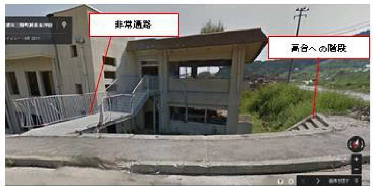
非常通路と高台への階段 (2011年9月のGoogleストリートビューより)