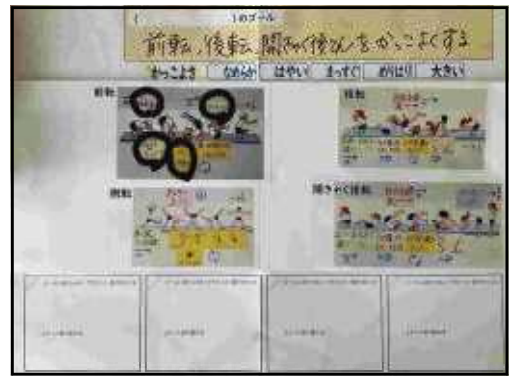
【自分のゴール追求シート】

子供たちは、6年生のような技ができるようになりたいという思いを高め、実際に試しながら技のポイントを見つけてきている。前時まで、一人一人が「1つの技を極めたい」「複数の技を極めたい」とそれぞれにゴールを設定している。自分のゴール追求シートには、自分のゴールと、前時までの振り返り、みんなで見つけた技ごとのポイントが書き込まれており、どのポイントができるようになったか丸を付けて記録している。