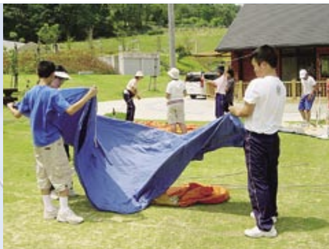
養護学校中学部キャンプ 善通寺 鉢伏ふれあい公園