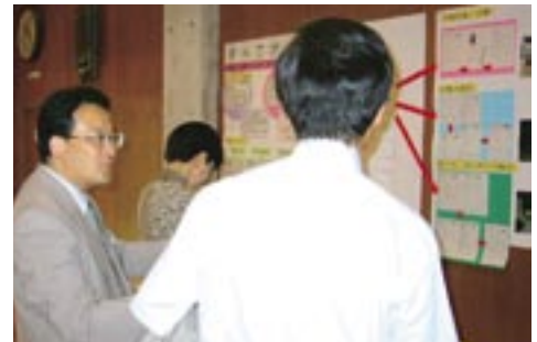
【体育館でのパネル発表】

各教科、2本の研究授業を公開しました。「豊かな学び」を創造するために、自分の学習状況を的確に認識しながら、自己の学びを自分の力で創り上げていく授業展開を提案しました。また、「5・4制」の研究より、中学校で学ぶ小学校6年生の理科の授業、さらに、小6・中1合同の保健体育の授業も多くの参観者の興味を惹くものでした。新聞やテレビでも報道され全国的にも話題性の高い実践として注目を集めました。