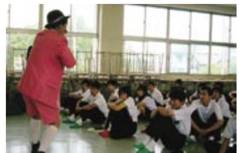
まⅡCコース「自己の感情表現」