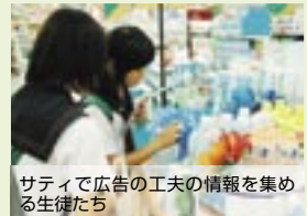
サティで広告の工夫の情報を集める生徒たち

Aコース「友だちをより知ろう！（番の州公園）」/Bコース「外国人とのコミュニケーション活動（アイパル香川と香川大学）」/Cコース「自己の感情表現を模索しよう！（香風園など）」/Dコース「メディアのプロに学ぼう！（KBNとサティ）」/Eコース「地域の環境（公園）をチェックしよう！（香風園、御供所公園など）」/Fコース「人が生き物に与える影響～人はどこまで近づけるのか～（角山頂上）」…あいにくの雨模様でしたが、生徒は自己課題の解決に向けて真剣に取り組んでいました。