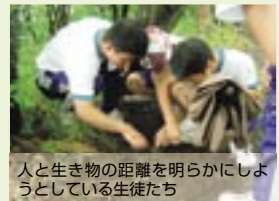
人と生き物の距離を明らかにしようとしている生徒たち