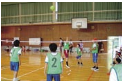
小6中1合同バレーボール