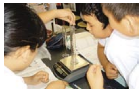
中学校での小6理科授業