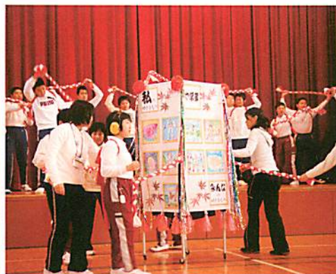
中学部のねぶた踊り「ラララ・ラッセーラ」