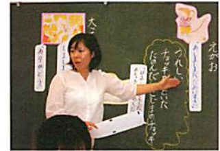
【前の場面とつなげて様子を捉え直す】

このような2つの言語活動を通して、「いろいろな時の登場人物になってみる」という思考様式のよさを共有化していきました。