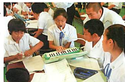
【音のイメージ図を基に話し合う】

この工夫を生かし、自分たちが作った曲の高低変化を視覚的に捉えることができる音のイメージ図を表し、実際の音を鍵盤ハーモニカで見つけていきました（体験の言語化）。そうすることで、曲の盛り上がり表現するために音の高低に目を付けて旋律を工夫する思考様式のよさを実感していきました。