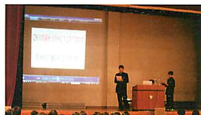
【CM制作プロジェクト】