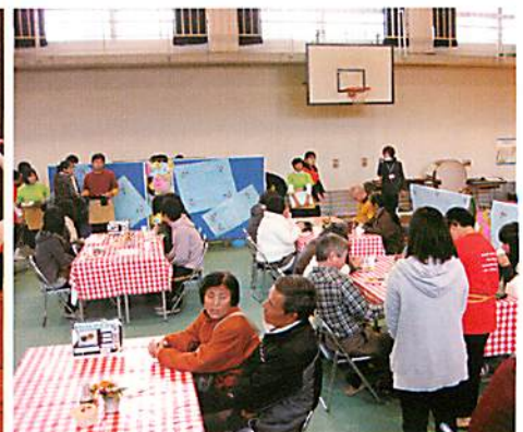
高等部の喫茶「まうんでんぴーち」