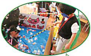
おやつ、上手く釣れるかな～？