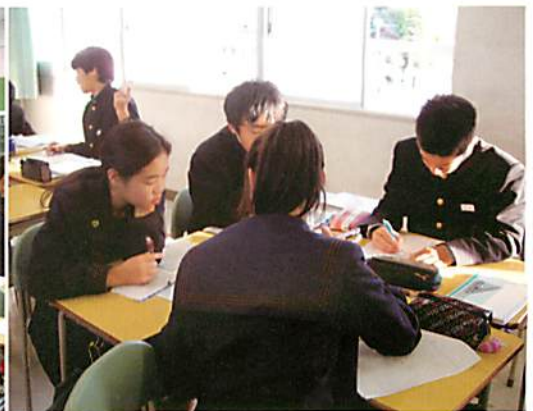
【グループで考え方を交流する場面】 (数学科)