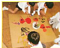
おばけの絵を描くぞ！

ハロウィンパーティーでは、3つの出し物をすることに決めました。ハロウィンめいろ、おかしつり、くじびきです。青組の子どもたちが10人前後の3つのグループに分かれて準備をしていきます。どのグループも話し合いから始まり、その中で案を出し合いながら、進めていきました。楽しく、嬉しく準備が進んでいくときもあれば、幼稚園全員分のくじやお土産などを作っていくことが大変で手が止まることもありましたが、パーティーに来てくれた人たちが喜ぶ姿を想像しながら、友だち同士で「がんばろう」と声をかけあったり、時に助け合ったりしながら進めていくのでした。