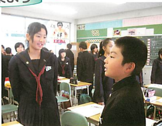
【ペアで説明・質問をする場面】 (国語科)

生徒一人一人の学びが何によってどのように変容していくのかを、生徒同士の交流や教師のかかわりから、分析・検証しています。