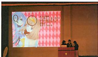
【アニメの大ヒットの法則を探究しよう】