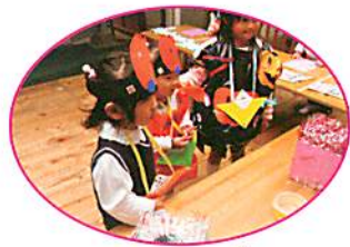
トリックオアトリート！くじをひかせてください♪

どこの出し物も、楽しむ人たちでいっぱいになりました。青組の子どもたちは、自分たちより年下の人にどうかかわったらいいかを考え、やさしく話しかけたりお菓子を渡したりしていました。幼稚園がおばけでいっぱいだったこの日。楽しかったという思いがどの人の心にも残るハロウィンパーティーとなりました。