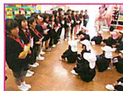
ハロウィンパーティーに来てね！