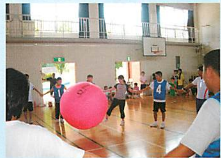
キンボールの様子