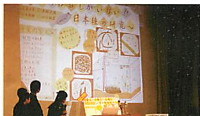
【救えるのは君しかないー日本種の研究ー】