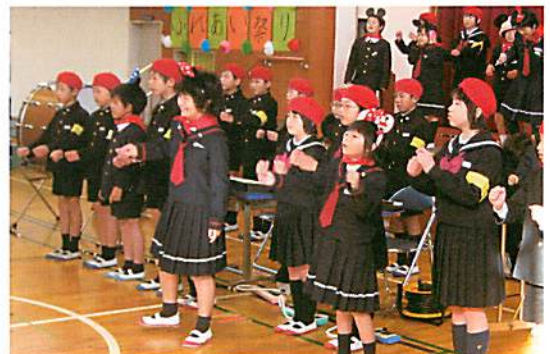
小学部府中小との交流演奏