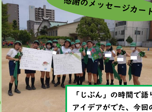
感謝のメッセージカード