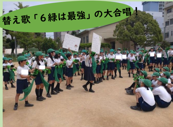
替え歌「6緑は最強」の大合唱!