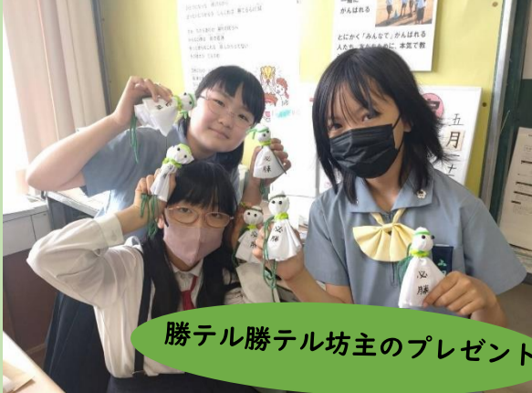
勝テル勝テル坊主のプレゼント