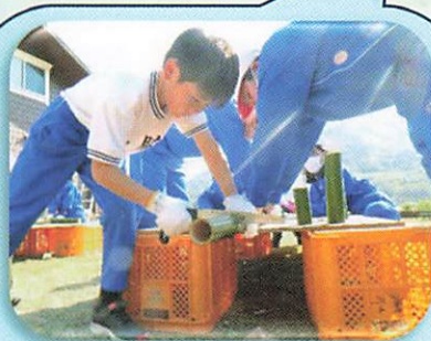
【「ちょうせん」の時間】

同学年の友達と関わりながら、問題解決的学習に取り組み、学んだことと生活をつないでいくことを目指します。