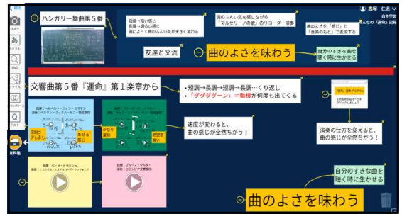
【みんなの『運命』記録】

前の鑑賞題材「ハンガリー舞曲第5番」で、友達との交流によって曲想と音楽の構造との関わりについての理解を深めたことが、曲をより深く味わうことにつながったことを想起させる。本題材においても友達との交流を通して『運命』のよさを見だしていくことを大型モニターを見て確認できるようにし、目標を見通しながら本時の学習内容を考えられている姿を教師が称賛する。そして、曲のよさを味わうことが自分の好きな曲を聴く時にも生かせるという意見を共有することで日常生活との繋がりも感じられるようにし、目標を達成することの価値を実感できるようにする。また、学習の内容を記録していき、目標に向けて『運命』についての理解が深まり、よさを味わう力がついてきていることを、視覚的に捉えることで実感し、振り返りの場面で「自分を信じる力」を発揮する働きかけになるようにする。