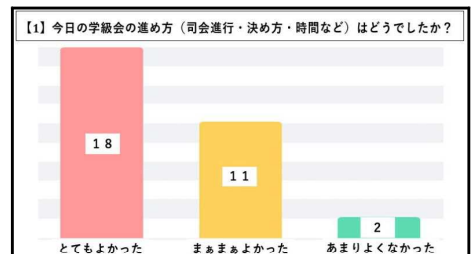
【振り返りアンケートの結果】

話合いの後に、学習支援アプリのアンケート機能を用いて、「話合いの進め方について」「決まったことについての納得度」「学級会への参加度（自分の考えをもてたか・考えを友達に伝えられたか・聞き方や態度はよかったか）」「次の学級会で頑張りたいこと」を記述する時間を設ける。振り返りの記入後に、「目標への情熱」「協調性」の価値付けを行う。そして、本時上手かったことを基に、次の目標を見いだしていることを称賛することで、「自分を信じる力」を発揮していることを自覚させる。また、「参加度」を低く自己評価した子供がいる場合は、発表ができなくても、グループで自分の考えを伝えたり友達の考えを聞いたりすることで学級会に参加できているということを全体で再度確認する。その後、グループごとに、お互いの頑張りやできていたことを伝え合う時間を設けることで、学級会に参加できていたことを感じられるようにし、「回復力」を発揮していることを自覚できるようにする。