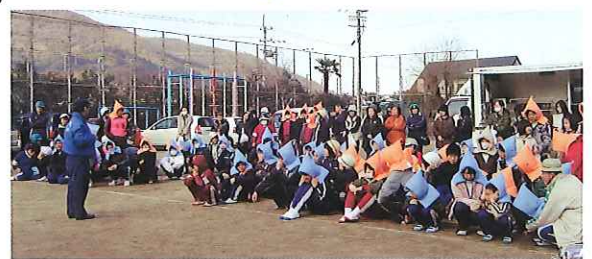
全校生と保護者で消防署の方の話を聞く