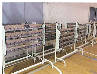
各クラス1台、合計12台完成です!!

歯磨き台においては昨年に学校からの要望もあり実現したく模索しておりましたところ、予算も付けて頂き2/16(土)2年ぶりに土曜メンテナンスを開催しました。当日は多数の保護者と先生方がボランティアとして参加して頂き、お母さん方もベンチ、ドライバー等の道具を使って奮闘し、楽しく作業ができました。コップ&歯ブラシ台は保護者の会社で設計しパーツも作っていただきました。組み立ても保護者立案の道具を準備し、パーツの研磨から加工、組み立てまで全て保護