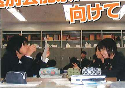
大道具・小道具の製作風景