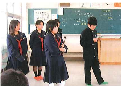
役者の人たちの練習風景

1年団は『河童の涙』を上演します。日常の学校生活の中でありがちな問題を取り上げ、河童の目を通して、今一度その問題を見つめ直していきます。卒業される3年生の皆さんに、中学校生活を振り返ってもらいながら、「思いやり」や「優しさ」とは何かについて、考えてもらえたら…と思っています。初めての送別芸能祭に向けて、ビデオを見せてもらった昨年、一昨年先輩方の演劇に少しでも近づけるよう120名が一丸となって頑張ります。