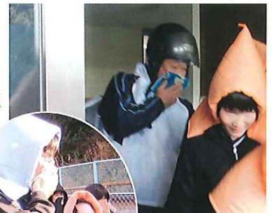
防災ずきんの 練習も完璧