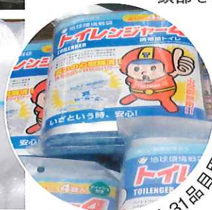
防災グッズも31品目用意