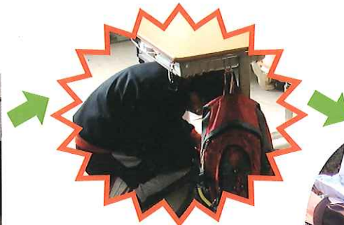
机の下にもぐって 頭部を保護