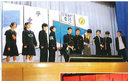
附属坂出中学校 送別芸能祭 (2008.3.13)