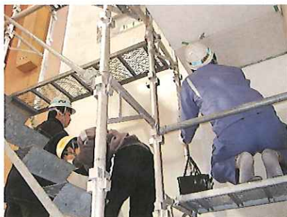
プロじゃありません。ボランティアです!!

小学校ではうがい・歯磨きを毎日していますが、これまで校内には歯ブラシ・コップを保管する場所がなく雑然としたままでした。また、体育館正面の左右の壁もひび割れ、はがれが激しく痛んでいる状態でした。