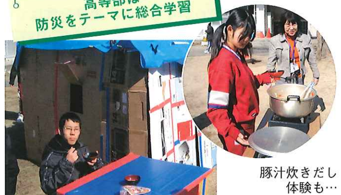
豚汁炊きだし 体験も...